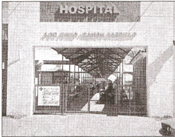
■ Hospital 4 de Junio.